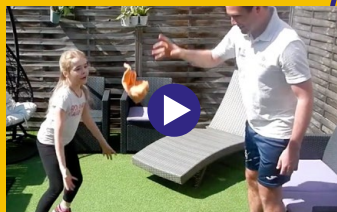
C'est la chute