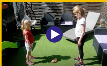
Jeu de la tête au pied

Découvrez les vidéos réalisées et jouer avec vos enfants pour faire 30 minutes d'activités physiques.